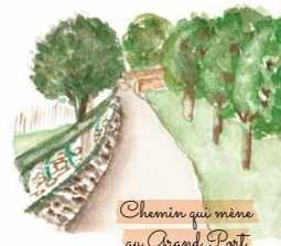
Chemin qui mène au Grand Port