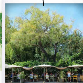
Restaurants sur place