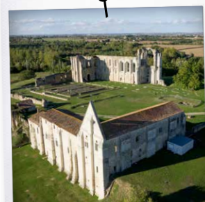
Abbaye de Maillezaïs