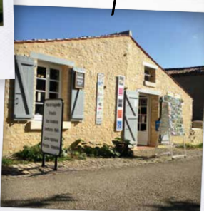
Boutique produits régionaux