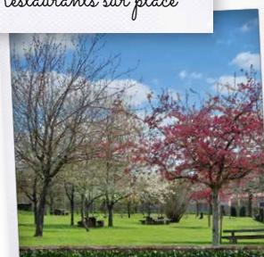
Aires de pique-nique à proximité