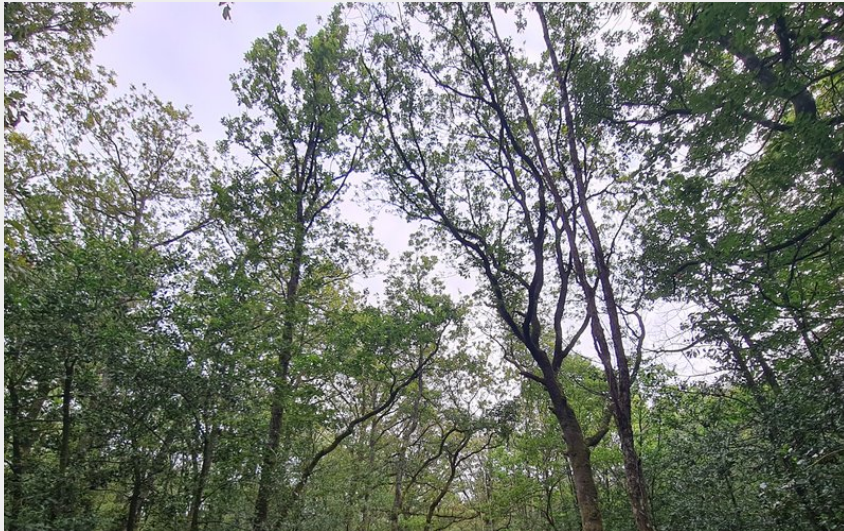
La Rotte aux loups (COMPA)