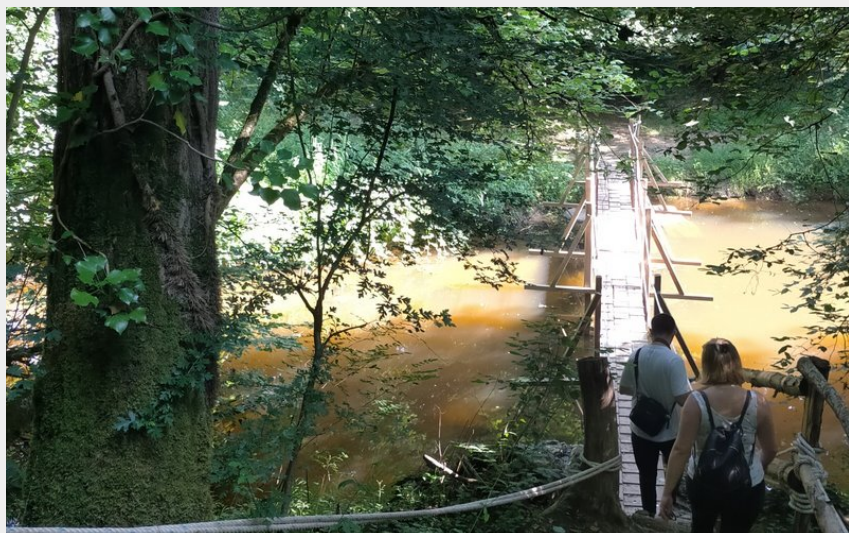
Circuit du Pont Noyer (COMPA)