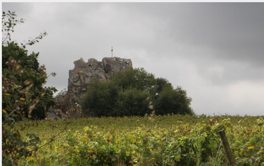
Les Pierres Meslières (COMPA)